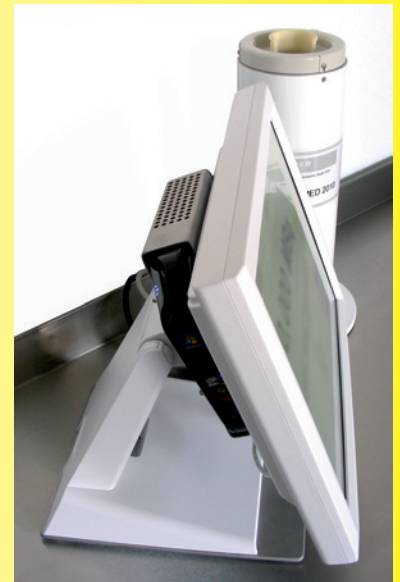
ISOMED 2010 mit NetTop und 15" LCD-Touch-Screen